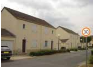
Antin Résidence après travaux