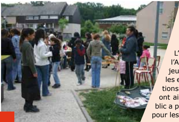
Fête des voisins, place des chênes

Fort de cette nouvelle dynamique créée entre voisins de différents quartiers de Nandy, un groupe de personnes s'est constitué afin de poursuivre cette belle aventure. Retenez leur nom, ils s'appellent : « Voisins d'abord ! ». Des idées sont déjà nées pour mieux animer notre Ville au delà de la fête des voisins.