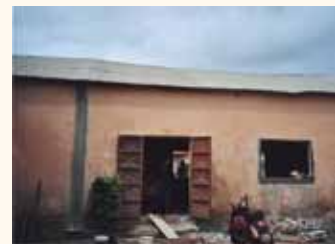
Bibliothèque avant travaux