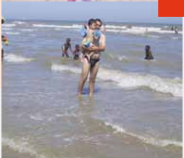
Sortie à Ouistreham