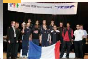
Podium des champions du monde