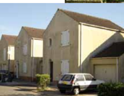
Antin Résidence avant travaux