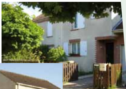
immobilière 3 F avant travaux

Opievoy : mène un diagnostic sur l'ensemble des chaudières, et a sécurisé certains accès (rampe d'accès place des Chênes).