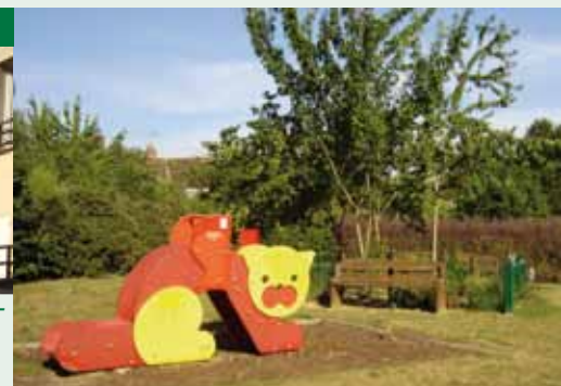
Réaménagement espace de jeux de la Clairière.