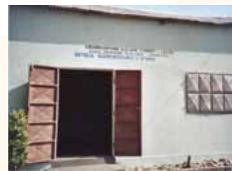
Bibliothèque après travaux