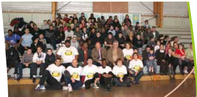
Journée « Nandy contre les discriminations »

La discrimination, tout le monde en parle car chacun y a été confronté d'une manière ou d'une autre, en tant que victime, mais aussi en tant qu'acteur ! Le Centre social s'est appuyé sur ce constat pour développer un projet d'envergure avec les nandéens, et surtout grâce à eux, à leurs témoignages, leurs réalisations et leur investissement personnel et artistique dans cette aventure ! Fort de son succès auprès des habitants, le Centre a renouvelé cette expérience en début d'année, et compte bien surfer sur ce succès pour proposer de nouvelles initiatives de ce genre.