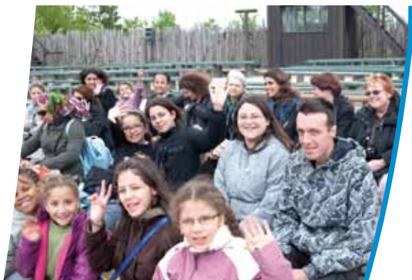
Sortie Familles à Provins en mai dernier

Les activités proposées par l'espace « Atout âge » s'adressent aux jeunes de plus de 15 ans, aux adultes, et aux familles. Qu'il s'agisse d'ateliers, de sorties, de soirées, de permanences ou de projets plus généraux comme le « Jardin d'été », chaque action invite tout un chacun à participer, à partager ou à échanger. Il s'agit plus d'interagir avec l'activité que de simplement la « consommer » !