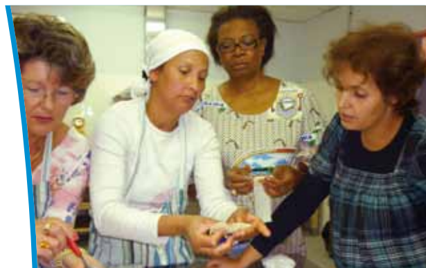
Un atelier « Cocktail de savoirs culinaires »

Il peut s'agir de couture, d'arts plastiques, de cuisine et d'ateliers pour apprendre le français ou bien l'informatique. Atout âge propose des activités qui permettent le plus possible, l'échange de savoirs, de compétences ou de conseils qui peuvent aider dans les choses du quotidien.