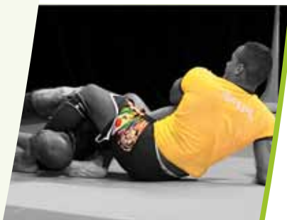
Cours de grappling proposé par le Club