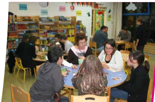
Soirée jeux à la Ludothèque

La ludothèque accueille les nandéens sur place, organise des soirées jeux tout au long de l'année, et prête aussi des jeux pour mieux les tester à la maison. Mais son rôle consiste surtout à favoriser le lien parents-enfants, à permettre aux parents de jouer et d'échanger avec leurs enfants, et parfois, de leur apprendre des choses de façon beaucoup plus ludique.