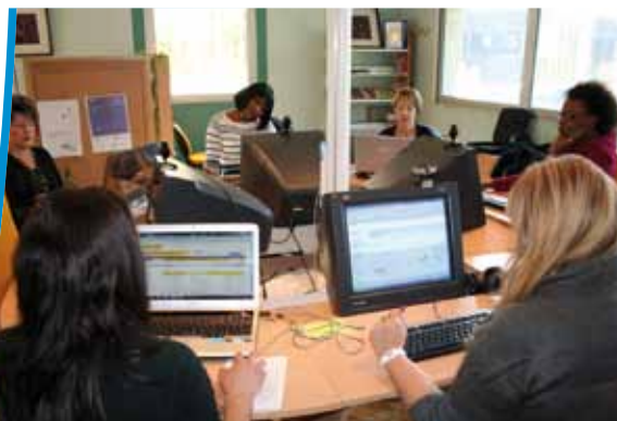
Lors d'un atelier multimédia à Atout âge

Il s'agit là de proposer aux habitants, un « lieu-ressources », en partenariat avec le service emploi de la ville.