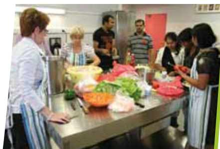
Préparation de la soirée Sri-Lankaise à l'espace Atout âge

Un Centre social est donc avant tout un lieu d'animation pour lutter contre la solitude, pour développer la solidarité et pour construire des projets en commun avec les habitants. La particularité du Centre social de Nandy est d'être « multisite » : ses actions sont menées par plusieurs structures, sur plusieurs lieux.