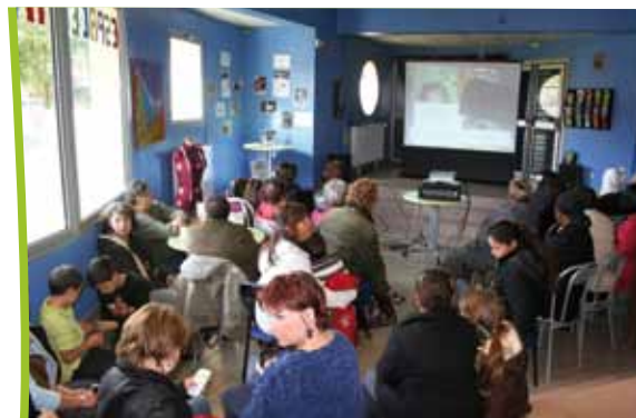
Soirée de présentation du programme du Centre social en septembre

Enfin, un projet « social sport » souhaite s'appuyer sur les valeurs sportives pour proposer aux nandéens de s'initier à certaines disciplines tout en partageant leurs propres compétences ! Mais peut-être avez-vous encore d'autres idées à partager ?!