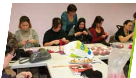
Stage « Tendance Tricot » lors des dernières vacances de la Toussaint