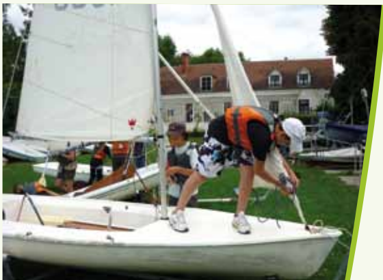
Les jeunes du Club à l'occasion d'un stage de voile en août dernier

Enfin pour tous ceux qui veulent prendre le grand air, il y a aussi les séjours : ski en hiver et sports nautiques l'été. Y'a plus qu'à se renseigner !