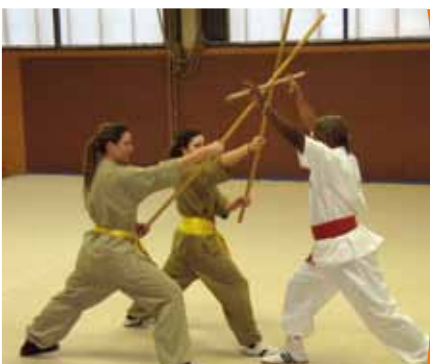
Vô Khi Thuat

Art martial traditionnel vietnamien d'attaque et de défense employant des armes de toutes sortes, le Vô Khi Thuat consiste à attaquer avant tout les bras et jambes de l'adversaire afin de contrecarrer ses possibilités d'attaque et de défense. Le but est d'atteindre le corps en cherchant à frapper sur des points vitaux.