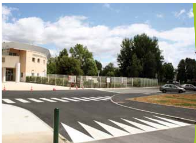
Plateau surélevé et nouvelles règles de circulation au carrefour 18 Sous / Roseaie.

Les travaux l'ont assailli de toutes parts cet été, pour laisser place à de nouveaux trottoirs, parkings, chemins et autres aménagements de voirie ! Il s'agit là d'une partie des grands travaux prévus au Contrat Urbain de Cohésion sociale (CUCS). Sur la rue des 18 Sous, vous avez sans doute aperçu de nouveaux parkings, et des accès à l'école des Bois et autour de l'étang