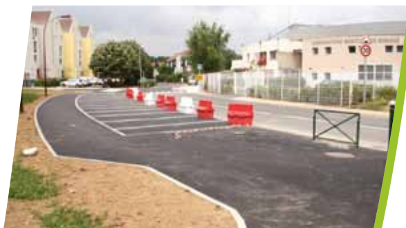
Quartier des Bois : les abords du collège avant et après travaux.