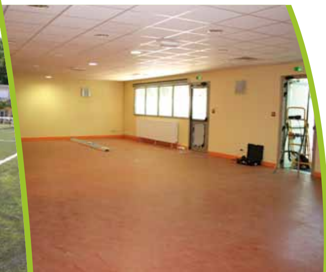
Ouverture de la « Maison des Familles »