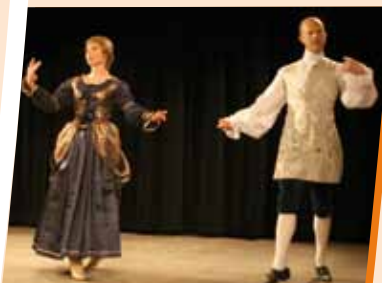
« Scène Arts et Danse à Nandy »

C'est la petite nouvelle des associations nandéennes ! « Scène Arts et Danse à Nandy » mise sur l'originalité par l'ancienneté ! Vous découvrirez ici la danse à ses différentes époques : danse classique, danses anciennes européennes, danses baroques ou de