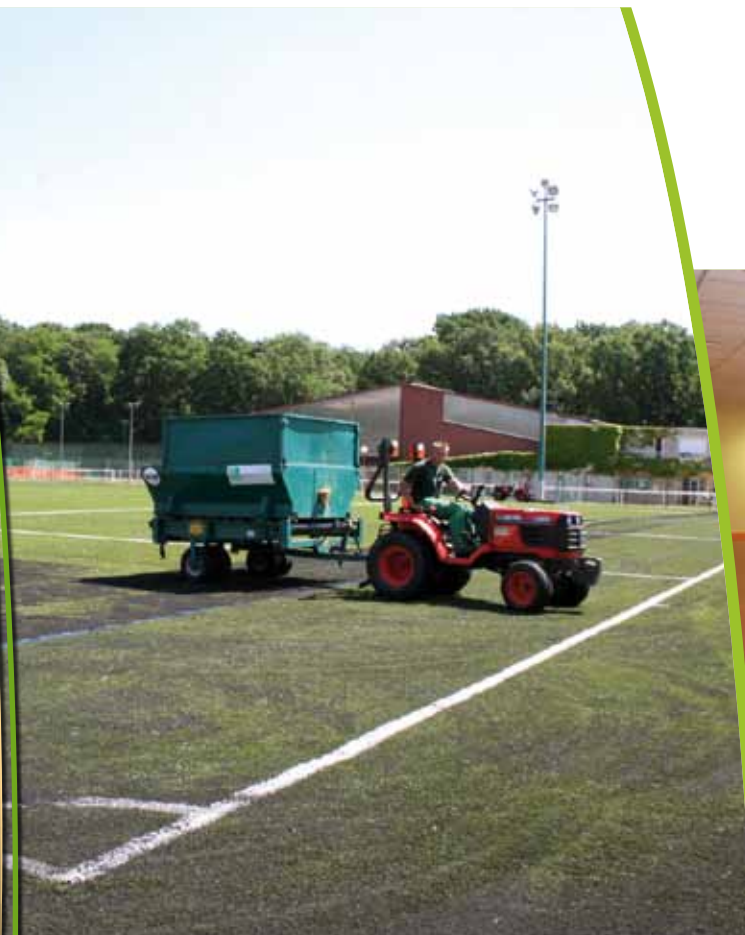
Du nouveau sur le stade