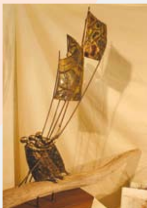
Oeuvre d'Isabelle Masson Faure

Les nandéens le connaissent bien maintenant, et le Marché reste chaque année, l'occasion pour chacun, amateur ou simple candidat à la découverte de belles choses, de rencontrer la réalisation, l'œuvre qui le fera craquer ! Et nul besoin pour cela d'être fin connaisseur. Un brin de curiosité vous fait très vite entrer dans l'univers universel du Marché d'Art ! Pour ceux qui n'ont pu s'y rendre, ne ratez pas, l'an prochain, le 10 ème anniversaire de cette belle aventure.