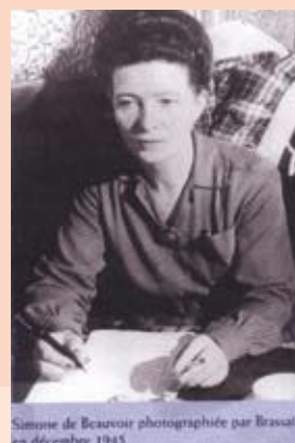
Simone de Beauvoir photographée par Brassai en décembre 1945.

Le Centre Atout âge organisait du 7 au 10 mars, une exposition tous publics sur l'évolution des droits de la femme. Evolution à travers le droit bien sûr, mais aussi à travers les destins de grandes femmes qui ont chacune marqué leur époque. Une expo que chaque visiteur a pu apprécier selon ses propres repères.