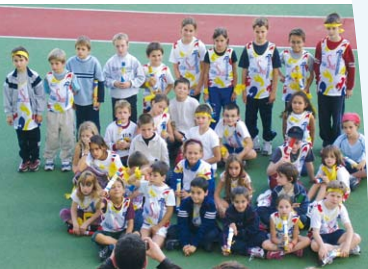
Les jeunes sportifs de l'association FSAC

« Le budget 2006, voté le 27 mars dernier, prévoit en effet une légère augmentation de l'enveloppe globale allouée aux associations (+4,6%). La Ville a toujours souhaité encourager l'élan associatif et sportif qui la fait vivre. En conséquence, plusieurs actions sont prévues, à commencer par le cofinancement de 2 emplois tremplins en vue d'améliorer le fonctionnement des associations de Basketball et de football. La Ville financera également cette année, la réfection des deux terrains de tennis couverts ».