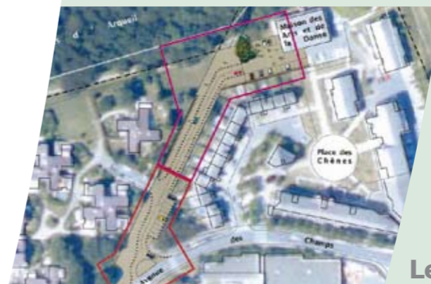
Le chemin d'Arvigny

Point stratégique de la promenade du chemin des acacias, la Passerelle qui enjambe l'avenue Olof Palme relie le quartier de Villemur à celui, des Bois. La mise en valeur de la passerelle prévoit une réfection totale du revêtement et intègre la sécurisation des accès. Dans le cadre de la mise en lumière du chemin des acacias, l'implantation d'un éclairage public permettra également de renforcer le caractère sécurisant tout au long du parcours et aux abords de la passerelle.