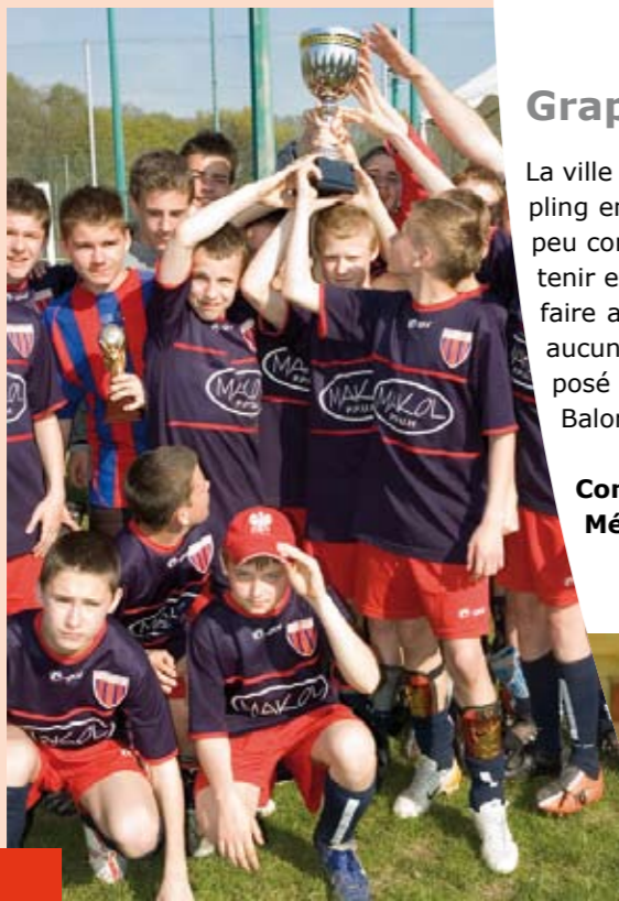
Équipe de Brevannes