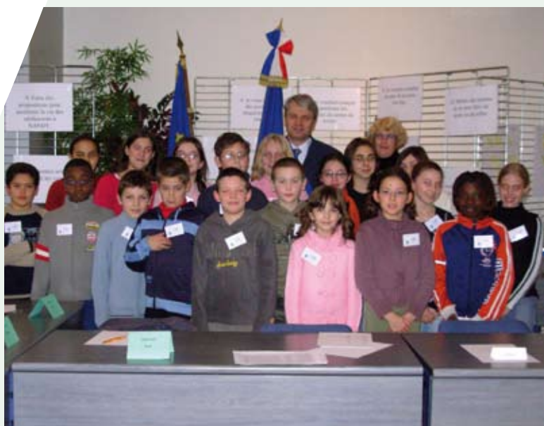
Le Conseil municipal junior en séance plénière, en présence du Maire, René Réthoré