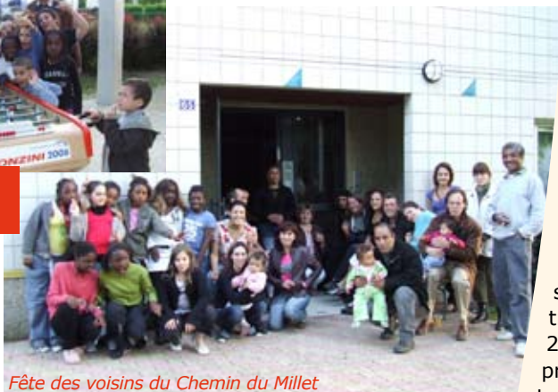
Fête des voisins du Chemin du Millet