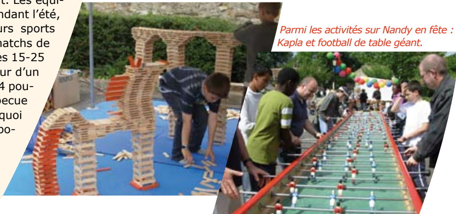
Parmi les activités sur Nandy en fête : Kapla et football de table géant.

Vous avez été nombreux à participer aux animations que proposait Nandy en fête le 23 juin. Géants, Sorciers Hopis, Saltimbanques, Batucada, théâtre, jonglage, jeux géants et animations en tous genres pour tous les goûts et tous les talents ont animé cette belle journée. Invitée d'honneur sur la fête, la délégation mauritanienne était également accueillie le matin en mairie pour signer le parchemin qui scelle l'engagement et la riche coopération des communes de Tiguent et de Nandy depuis 20 ans. A cette occasion, les conseillers municipaux juniors ont remis à la délégation la somme de 400 € qu'ils ont recueillie en organisant une Boum au profit de Tiguent. Une belle initiative qu'on ne peut que féliciter !