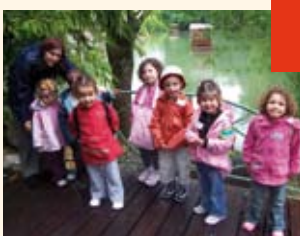
Sorties «Nigloland» et vélo ...

Les enfants ont mis beaucoup d'énergie pour braver cet été frisquet. Et pour se réchauffer un peu entre deux activités vélo ou parc de loisirs, quoi de mieux qu'une croisière sur le thème des îles ensoleillées. Cuba, la Martinique, La Nouvelle Zélande, Tahiti ou la République dominicaine ... le programme fut chargé, mais le soleil était sur tous les visages !