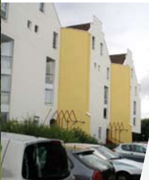
Trois Moulins Habitat après travaux. (Quartier des Bois)

Régulièrement, Nandy Infos revient sur les travaux engagés par chacun des bailleurs présents sur la commune. Les opérations d'amélioration et de rénovation qu'ils ont entrepris sur Nandy se poursuivent en concertation avec la municipalité et donnent l'occasion aujourd'hui de faire un nouveau point sur les réalisations en cours :