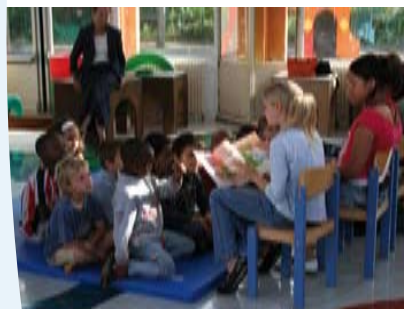
Lecture aux enfants par les collégiens

L'accès à la culture est un droit fondamental pour tous, quel que soit le handicap. En tenant compte de leurs difficultés propres, quelques jeunes autistes sont accueillis régulièrement au conservatoire qui leur propose un atelier de percussions. La bibliothèque les reçoit quant à elle chaque semaine.