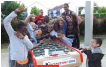
Babyfoot pour les enfants de «TMH».