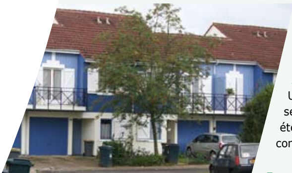
France Habitation après travaux (Les Bois)

Le ravalement des espaces collectifs et des pavillons est ici en cours. L'achèvement des travaux est prévu pour la fin de l'année, une fois effectuée la reprise des vérandas sur les collectifs.