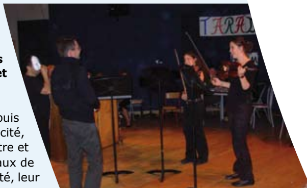
Le musicien mystérieux, au conservatoire

L'intercommunalité donne à l'action culturelle une dimension plus large et un apport de qualité. Nandy fait ainsi partie du réseau des musiques et du réseau des bibliothèques de Sénart. Les concerts des musiciens de Sénart, le Big Band, les opérations « Lire en Fête » et le « Printemps des poètes » en sont les manifestations les plus visibles. Des conventions passées avec la Scène nationale de Sénart et les « Concerts de poche » permettent aussi à la ville de recevoir des artistes d'envergure nationale et internationale, des prestations de grande qualité qu'elle ne pourrait se permettre seule.