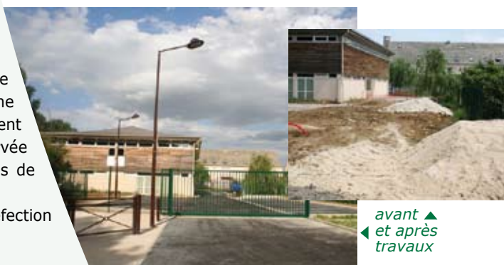
avant ▲ et après travaux