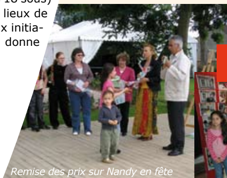
Remise des prix sur Nandy en fête