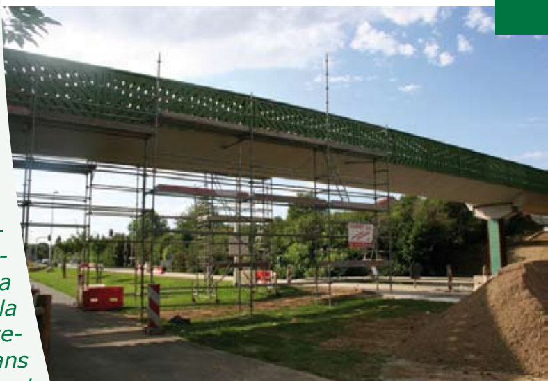
Passerelle sur l'avenue Olof Palme (Les Bois)