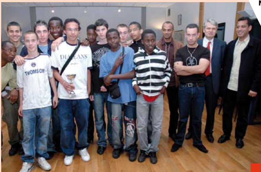
L'équipe des moins de 15 ans accède en «Excellence»

Seniors : finalistes de la Coupe de Seine-et-Marne.