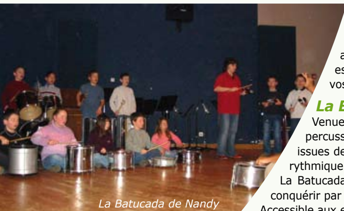
La Batucada de Nandy

Le conservatoire de musique de Nandy propose de nombreuses places au sein de deux ateliers différents :