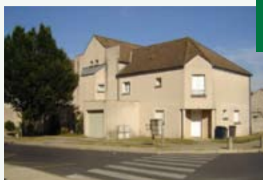
Trois Moulins Habitat avant et après travaux. (Quartier des Bois)

Des rencontres tripartites entre bailleurs, locataires, et la municipalité ainsi que des enquêtes et diagnostics accompagnent ces différentes opérations de travaux de rénovation.