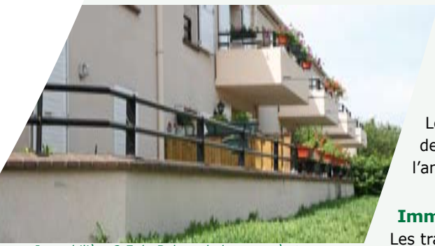
Immobilière 3 F du Balory: balcons après travaux

Une 2 ème tranche de travaux de ravalement est programmée pour le second semestre 2007, voire début 2008. Suite aux diagnostics qui ont été effectués, d'autres travaux font actuellement l'objet d'une réflexion commune, pour une programmation de travaux l'an prochain.