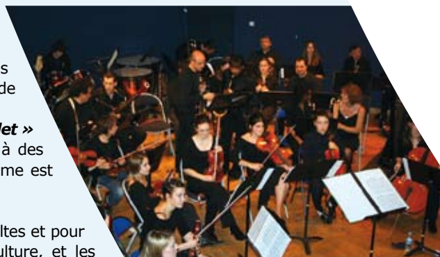
Les musiciens de Sénart