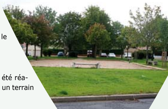
Place des palombes (Villemur)