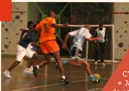
Foot en salle des 15-25 au gymnase Y. Montand.

Les nandéens de 11 à 25 ans ont eu aussi l'occasion de « cultiver » leurs vacances autrement. Les équipements sportifs sont restés ouverts pendant l'été, leur permettant ainsi de pratiquer leurs sports préférés. Foot, basket, handball ... les matchs de foot ont beaucoup animé le gymnase. Les 15-25 se retrouvaient tous les jeudis soir autour d'un barbecue à l'espace Atout âge. Les 11-14 pouvaient quant à eux organiser leur barbecue au Club tous les mardis, et parler pourquoi pas, de toutes les autres activités proposées pendant l'été par le Club.