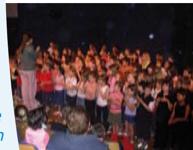
Chorale des enfants

Depuis de nombreuses années, Nandy poursuit une politique de « démocratisation culturelle », notamment en direction des enfants, centrée principalement sur l'accès à la lecture, à la musique, et complétée par une offre de spectacles, contes et concerts ouverts à tous. Nandy Infos propose ici un aperçu de l'offre culturelle de la Ville.