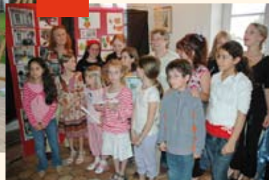
Peintres en Herbe 2007