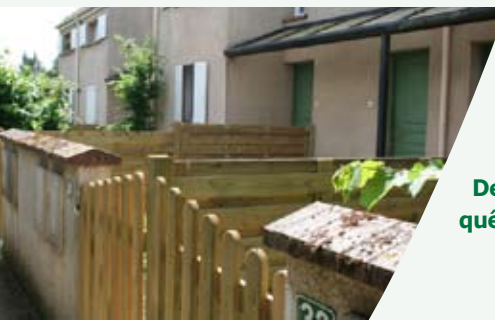
Immobilière 3 F du Balory : portillons après travaux

Les travaux présentés lors de la rencontre de mai avec le bailleur, les locataires et la municipalité se dérouleront sur le dernier trimestre : ravalement de façades, changement des menuiseries avec pose de double vitrage, nettoyage des toitures, reprise des gouttières et descentes des eaux pluviales, étanchéité des toitures de garages et ravalement, reprise des sols et remplacement des portes, aménagement des petits jardinets en façade et changement des boîtes aux lettres.