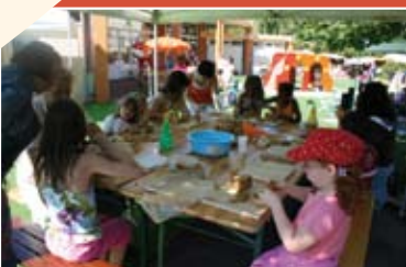
Atelier terre avec une plasticienne de l'Alliance des Arts.

Jardin d'été adresse un grand « Merci » et un immense « Bravo » à tous ceux qui ont contribué au succès de l'opération !