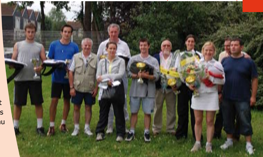
Finalistes de l'Open de tennis de Nandy