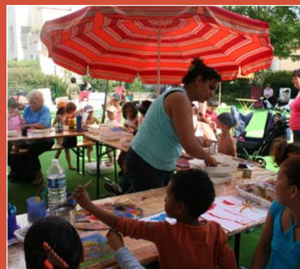
Arts plastiques et petites lectures pour les plus courageux !