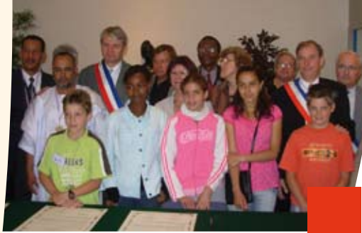
Le CMJ offre à la Mauritanie les bénéfices de sa Boum.