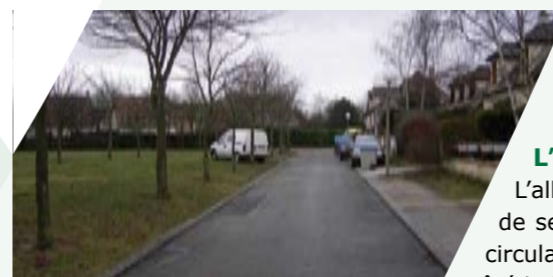
L'allée des Girolles