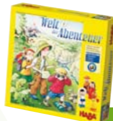
Le monde de l'aventure