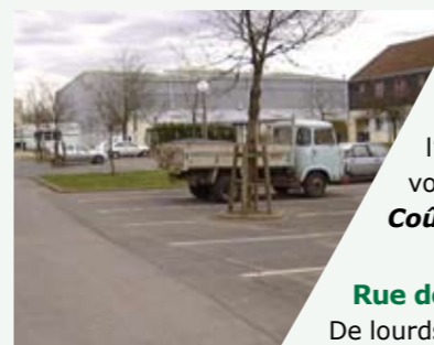
Rue du Stade