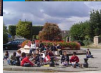
Atelier «décryptage du paysage»