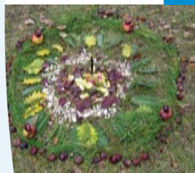
Oeuvre naturelle éphémère réalisée par les élèves de l'école des Bois