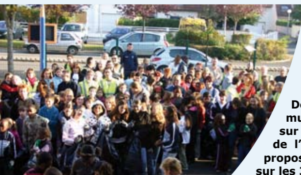
Journée propreté du CMJ

En cette rentrée placée sous le signe de l'environnement, il devient presque banal de parler de comportements citoyens et responsables envers notre planète et plus simplement notre cadre de vie. L'attention que nous devons porter à notre environnement n'a pourtant jamais été aussi lourde de sens et notre jeunesse l'a bien compris. Qu'il s'agisse du Conseil municipal junior ou des enfants de cours moyen de l'école des Bois, les jeunes nandéens oeuvrent activement depuis la rentrée sur plusieurs projets éco-citoyens... Et petit à petit, l'éco-citoyenneté fait son nid !