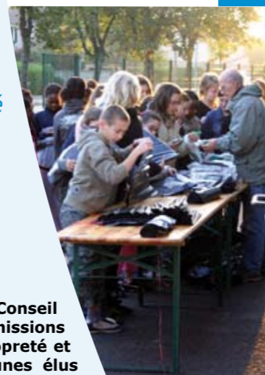
Journée propreté : préparation des équipements