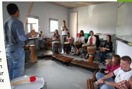
Atelier de percussions

Contact : Tél. : 01.60.63.62.93 ou Mél. : atoutage@nandy.fr