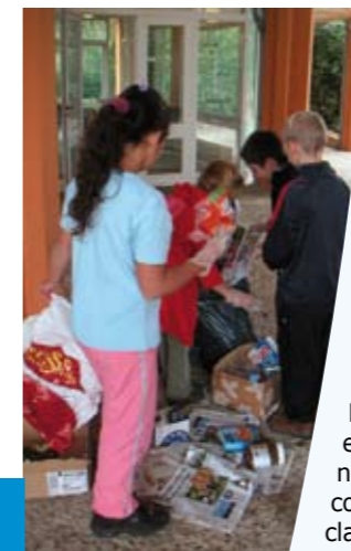
Atelier «observation des déchets» à l'école des Bois