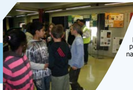
Exposition «déchets» lors de la matinée «propreté» du 6 octobre

L'école des Bois aurait tort de vouloir ignorer son nom. Située idéalement au pied du Bois d'Arqueil et de l'étang des Bois, l'idée de poursuivre l'initiative sur le thème de l'eau et de la forêt s'est très vite imposée. Les écoliers devraient être invités à courir une course d'orientation proposée en fin d'année dans la forêt de Rougeau. Des ateliers de « Land Art » seront aussi proposés. L'idée : réaliser des œuvres d'art éphémères à partir de ce que l'on ramasse dans la nature. Et là encore, les idées ne manquent pas !