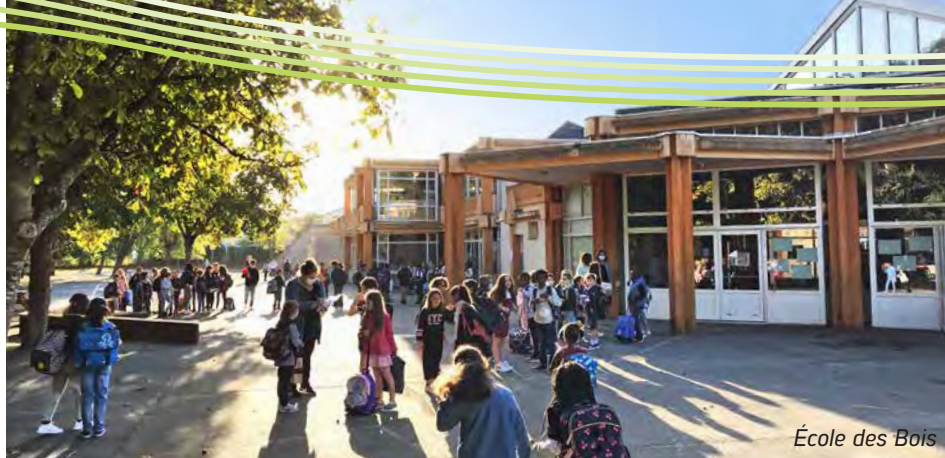
École des Bois