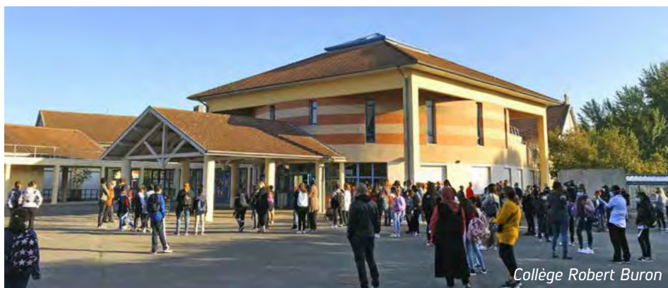
Collège Robert Buron

Le collège Robert BURON accueille 12 élèves scolarisés au titre des ULIS (unités localisées pour l'inclusion scolaire). Ces jeunes élèves, dont le handicap ne permet pas une scolarisation individuelle continue dans une classe ordinaire, bénéficient d'aménagements et adaptations pédagogiques mis en œuvre par les équipes éducatives.