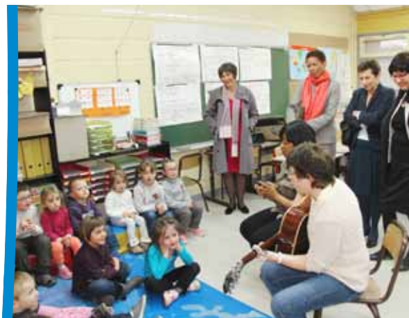
Atelier animation musicale