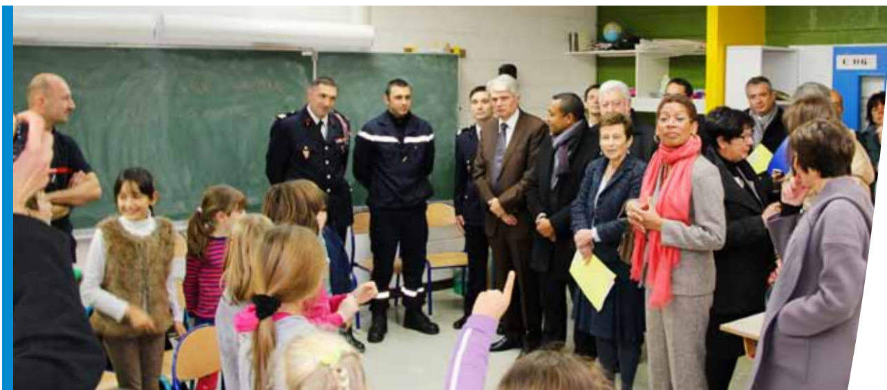
Atelier «risques domestiques»