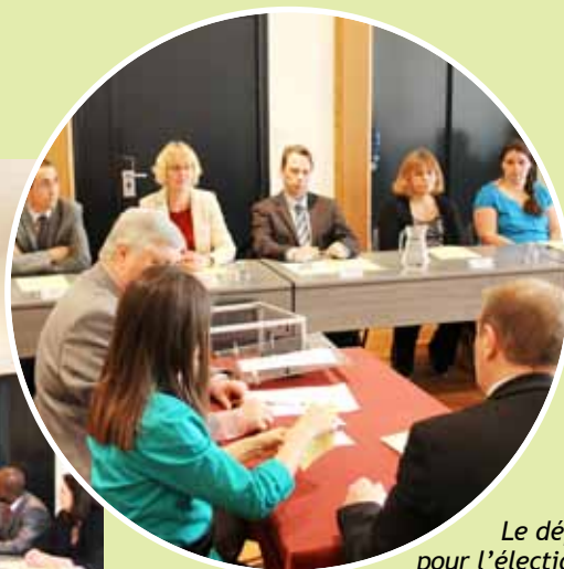
Le dépouillement pour l'élection du maire.