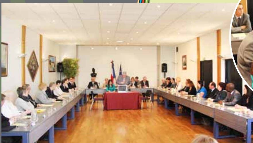
Les 29 membres du Conseil municipal se préparent à élire le maire.