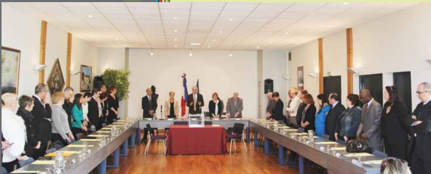
Installation du nouveau Conseil municipal. (séance du 29 mars 2014)

Le Conseil municipal se réunit sous la direction du maire au moins une fois par trimestre.