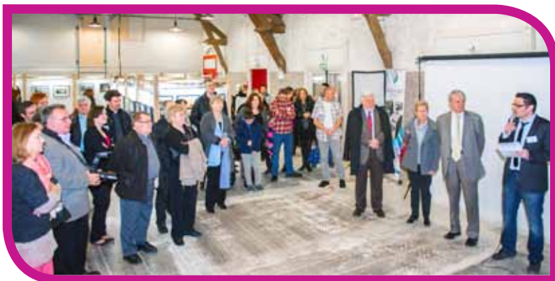
Plus d'une centaine de photographies ont ravi les visiteurs de « Contraste », 3 e exposition de l'Alliance Photographique de Nandy Sénart. 1 et 2/02

A 1, 2, 3... histoires à la Bibliothèque municipale Marguerite Yourcenar. 8/02