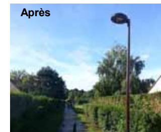
Chemin des Chevreuils