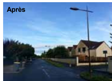
Rue des Sablons