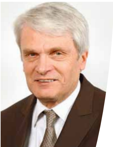
Le maire René Réthoré