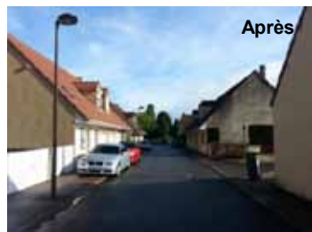
Rue des Almandins