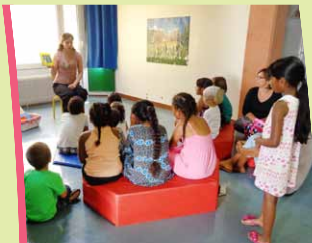
Lecture au Jardin d'été

Enfin, la bibliothèque s'ouvre aux associations qui apprécient y organiser expositions de peinture et photographies.