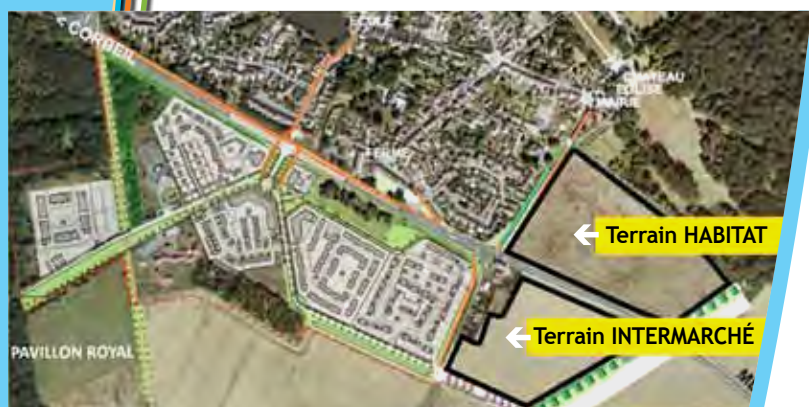
Quartier de la Forêt : transfert-extension du centre commercial