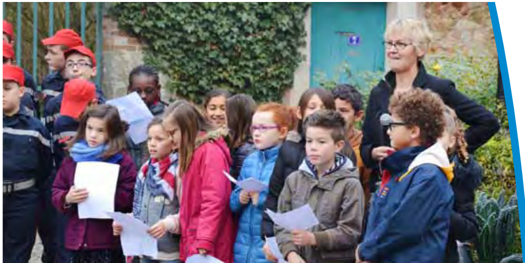
Participation à la cérémonie du 11 novembre.