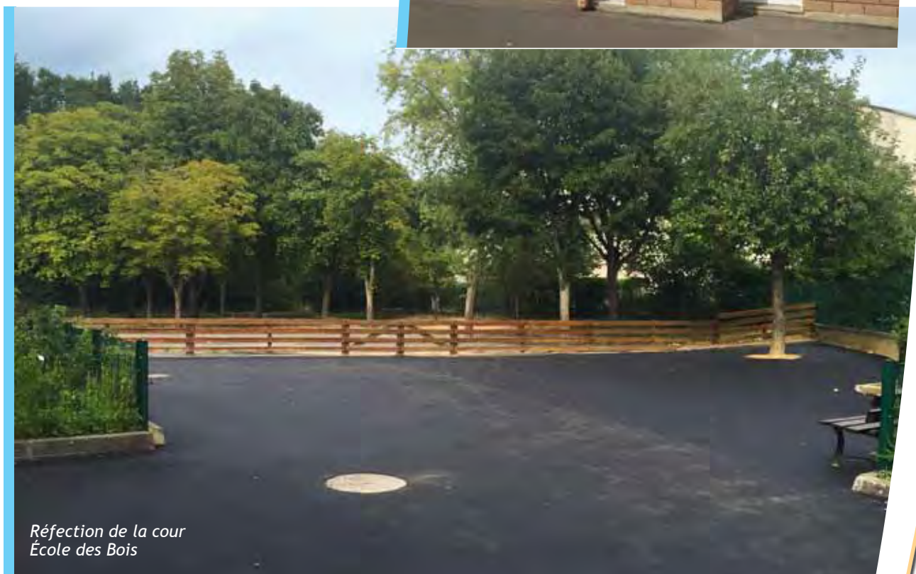
Réfection de la cour École des Bois