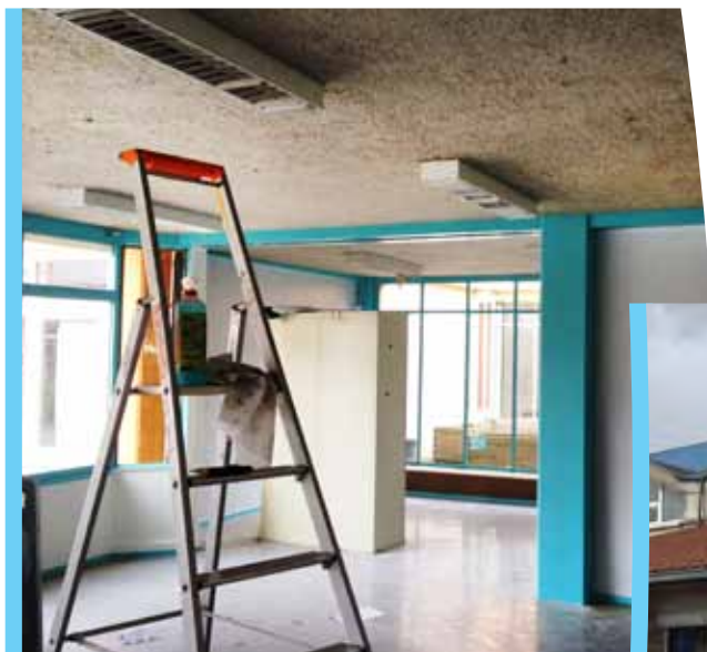
Rénovation d'une classe École des Bois

En l'état actuel de la réglementation appliquée par le Président Huchon, la ville peut conclure un troisième contrat régional de plus de 2.6 millions d'euros exclusivement affecté à la rénovation de nos 3 écoles et à leur isolation thermique. C'est un programme ambitieux qui sera présenté au conseil municipal du 6 décembre prochain.