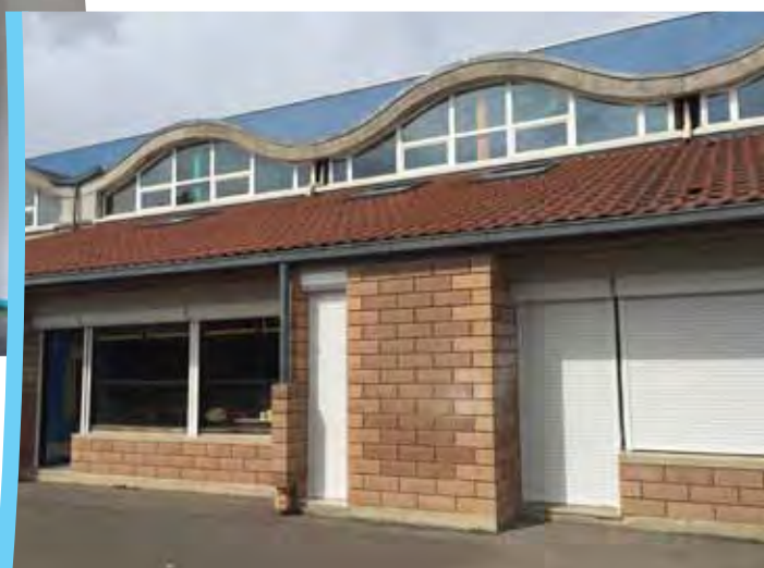
Nouveaux volets électriques École de Villemur