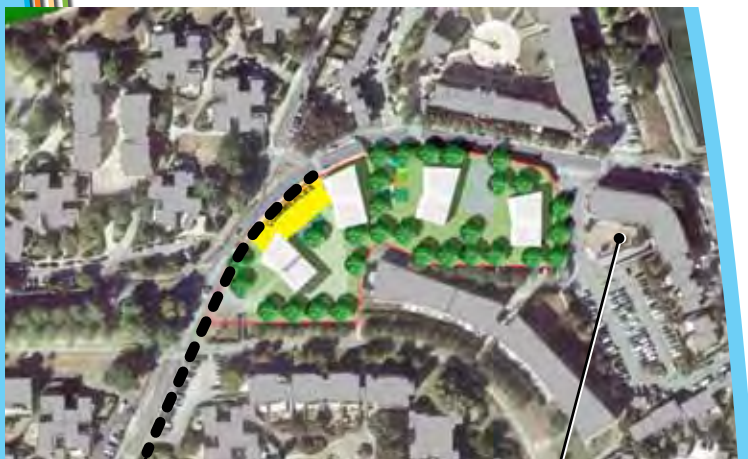
Avenue des Champs Place des Escourgeons