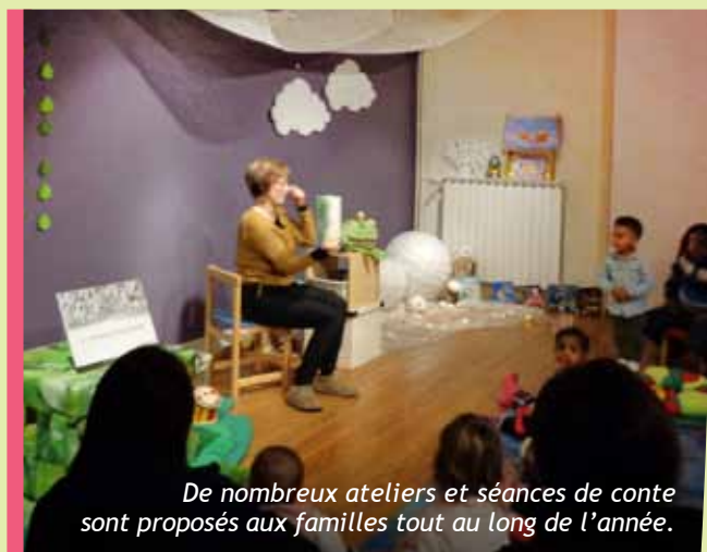
De nombreux ateliers et séances de conte sont proposés aux familles tout au long de l'année.

Le théâtre de Sénart propose aux adhérents de la bibliothèque une réduction sur la réservation de places.