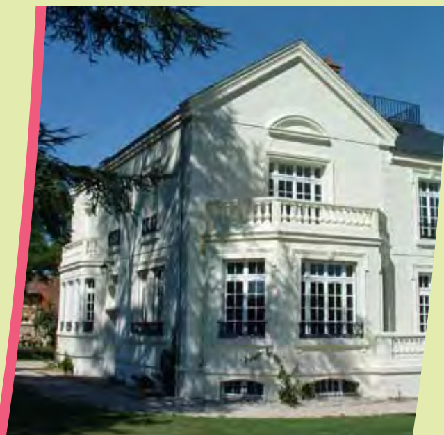
La bibliothèque M. Yourcenar

Une des dernières initiatives de la bibliothèque, le « Troc' Livre » et « Troc' Magazine ». « Ce sont des dons de lecteurs pour que les ouvrages aient une 2 e vie. Les adhérents se servent librement. C'est une autre façon de découvrir des auteurs, des livres... ».