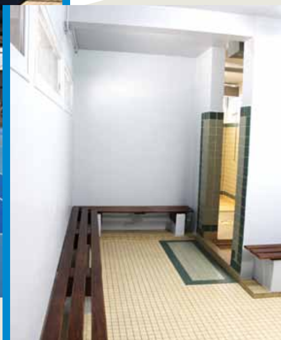
■ Vestiaires du stade M. Rougé