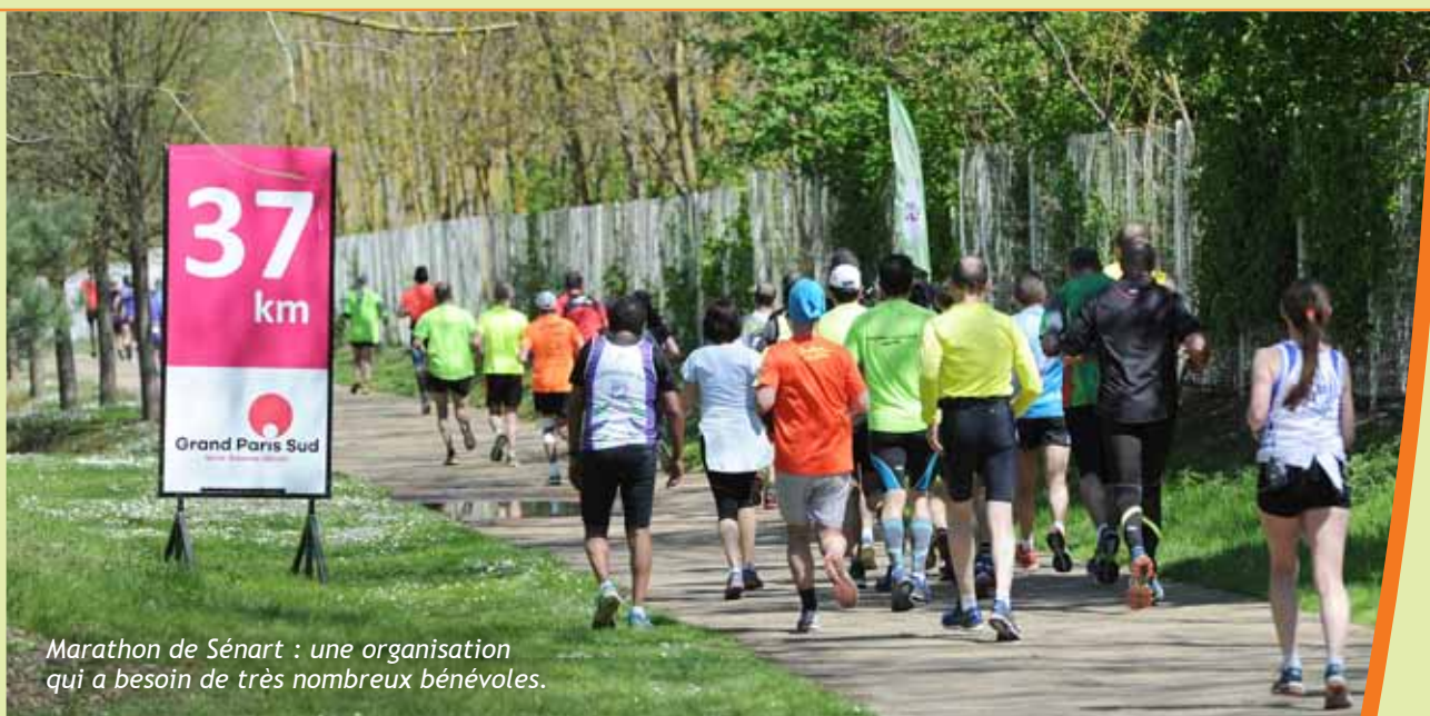
Marathon de Sénart : une organisation qui a besoin de très nombreux bénévoles.