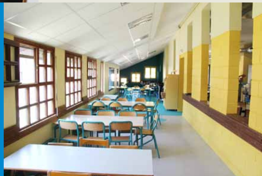
■ Restaurant scolaire du Balory