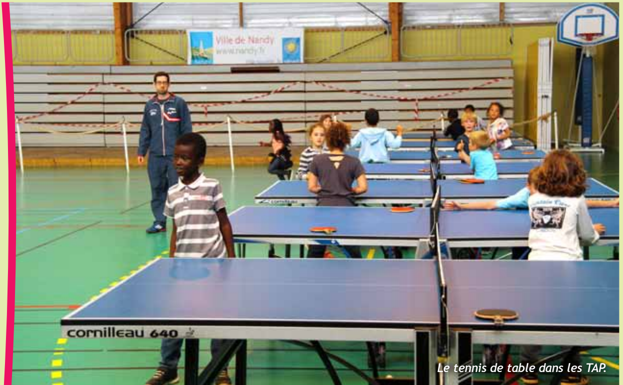
Le tennis de table dans les TAP.

A noter que les bénéfices de la brocante sont reversés à des associations sur la forme de financement de projets.