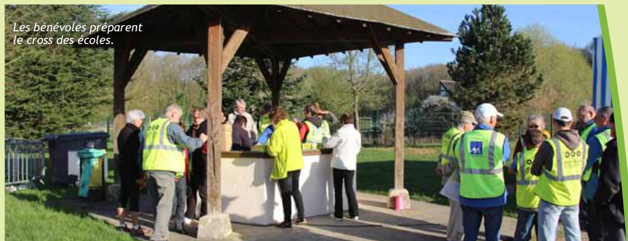
Les bénévoles préparent le cross des écoles.

« Ces bénévoles agissent déjà avec passion dans leurs associations respectives, mais apprécient de donner de leur temps pour les autres rendez-vous communaux. Je pense à la cinquantaine de bénévoles présents lors du Cross des Ecoles, mais aussi aux bénévoles du Trail du Four à Chaux, ou encore du Marathon de Sénart. Ils sont présents dès l'aube sur le lieu de l'animation pour l'installation et en fin de course pour le rangement. Il ne faut pas oublier les