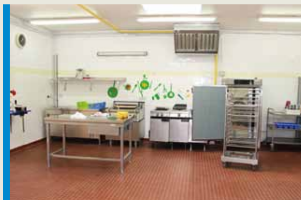
Cuisine du Balory ■