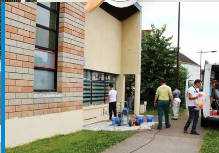
Club 11-14 ■