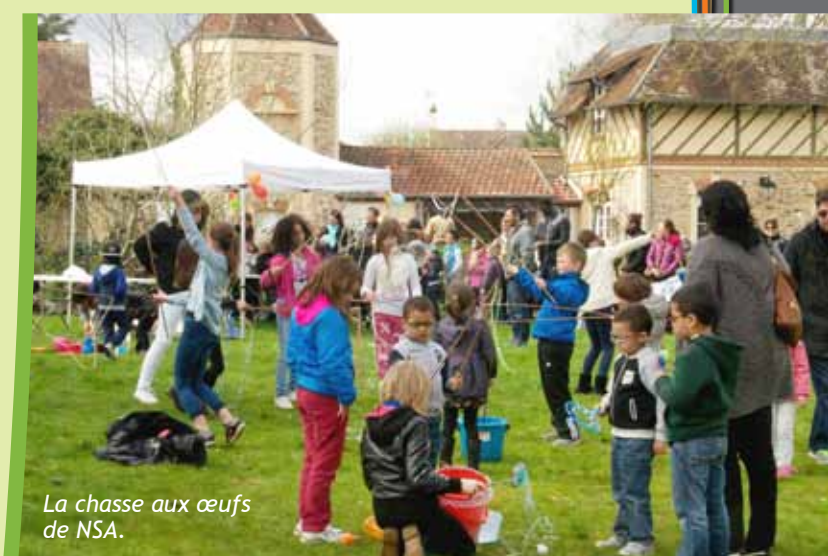
La chasse aux œufs de NSA.

De son côté, la mairie facilite le fonctionnement des associations en aidant, autant que possible, à préparer certaines manifestations.