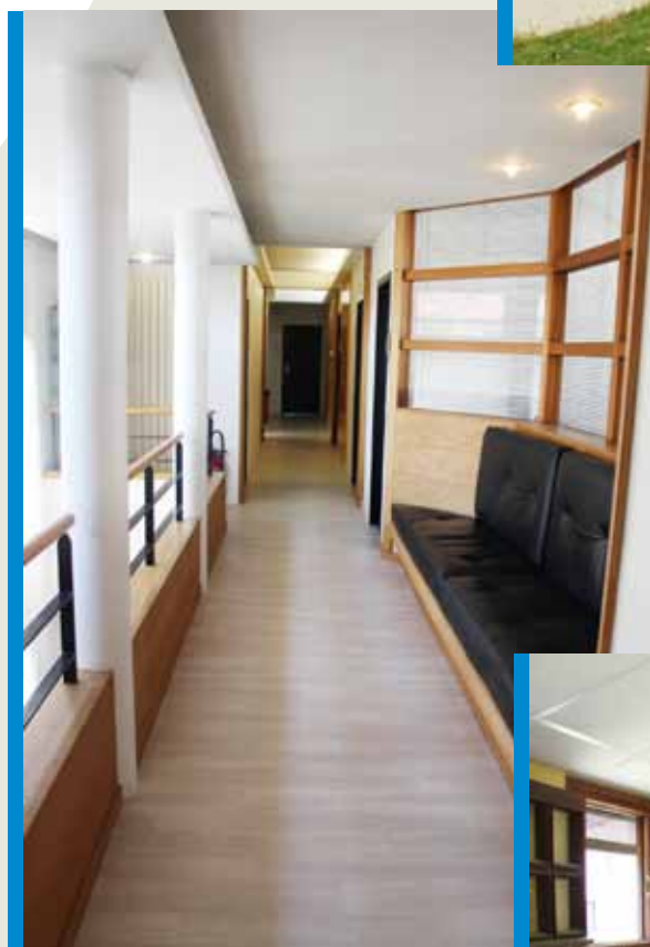
La mairie ■