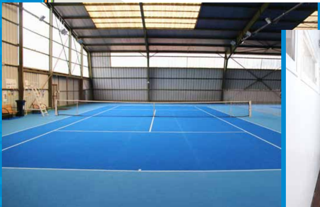
Courts de tennis couverts ■

Si les chantiers estivaux sont terminés, de nouveaux se précisent. Cet automne les programmes de travaux de voirie et d'élagage vont démarrer sur la commune.