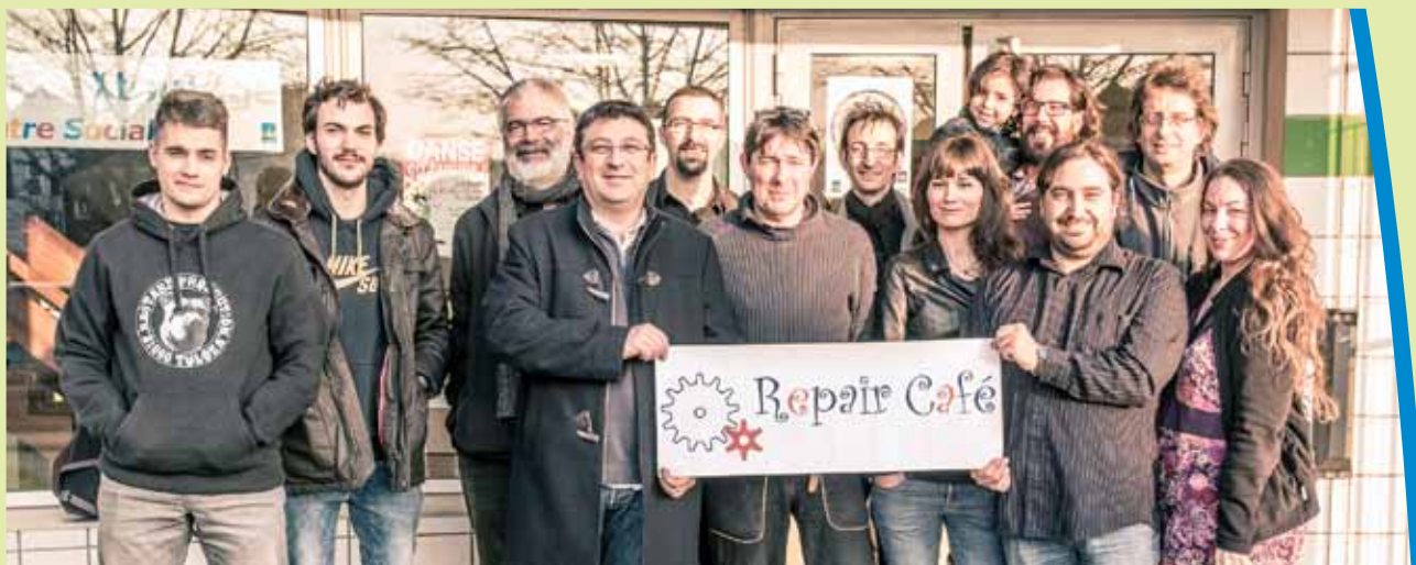
L'équipe des bénévoles de « Repair Café » devant le centre Atout âge.

Si la municipalité prend soin des associations, et de leurs adhérents, elle s'affaire à mettre à leur disposition des locaux, gymnases, terrains, en bon état pour la pratique des différentes disciplines.