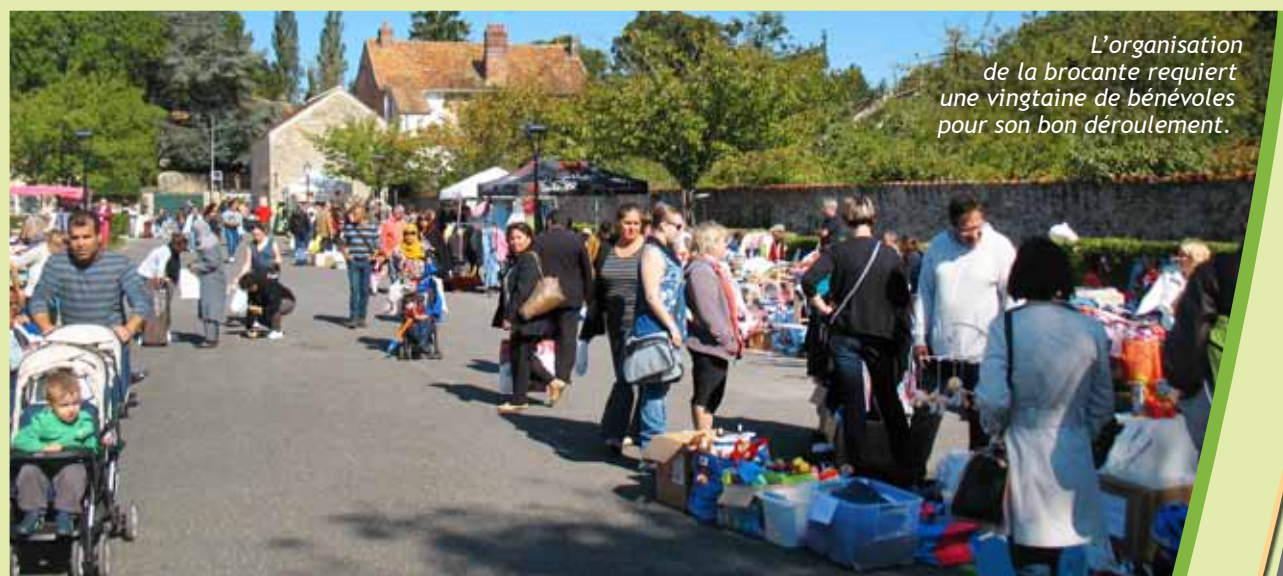
L'organisation de la brocante requiert une vingtaine de bénévoles pour son bon déroulement.