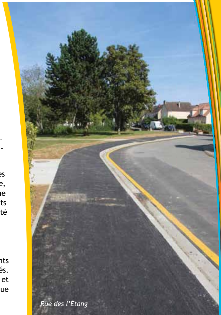
Rue des l'Étang

À l'angle des rues des champs et des grains, des points d'apports volontaires (PAV) ont été semi-enterrés. Le PAV de la place des escourgeons a été supprimé et remplacé par un nouveau PAV mieux adapté, situé rue des 18 sous.