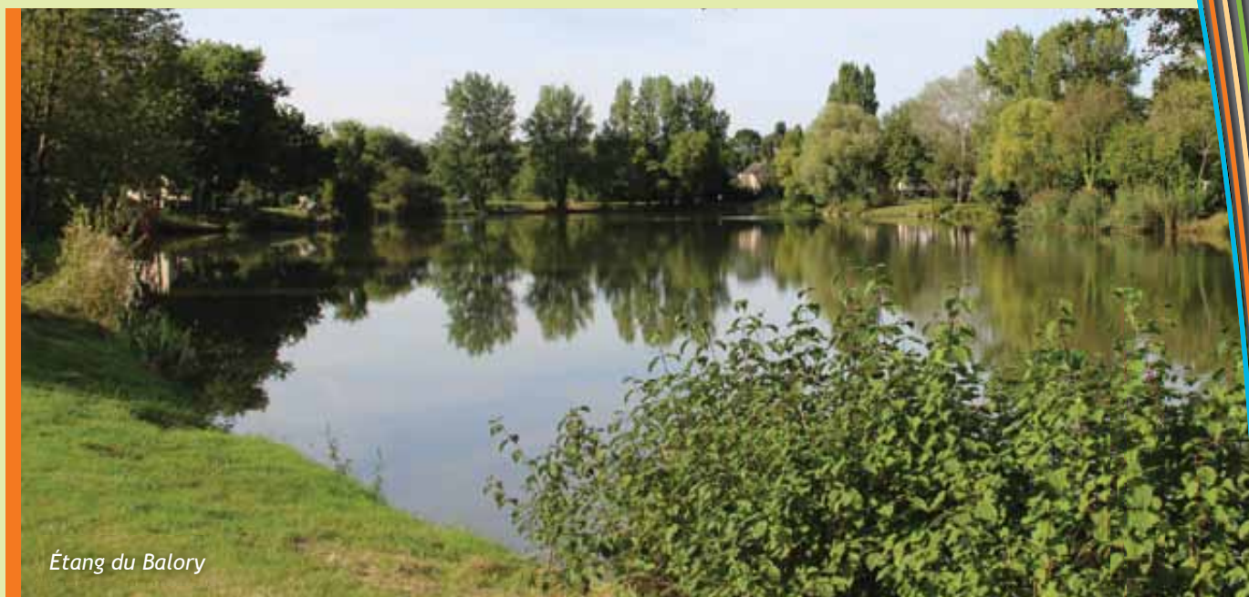
Étang du Balory