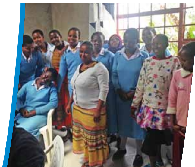
Centre de femmes

"Je leur dirai de voyager, de partir à la découverte du monde!" conclut-elle.