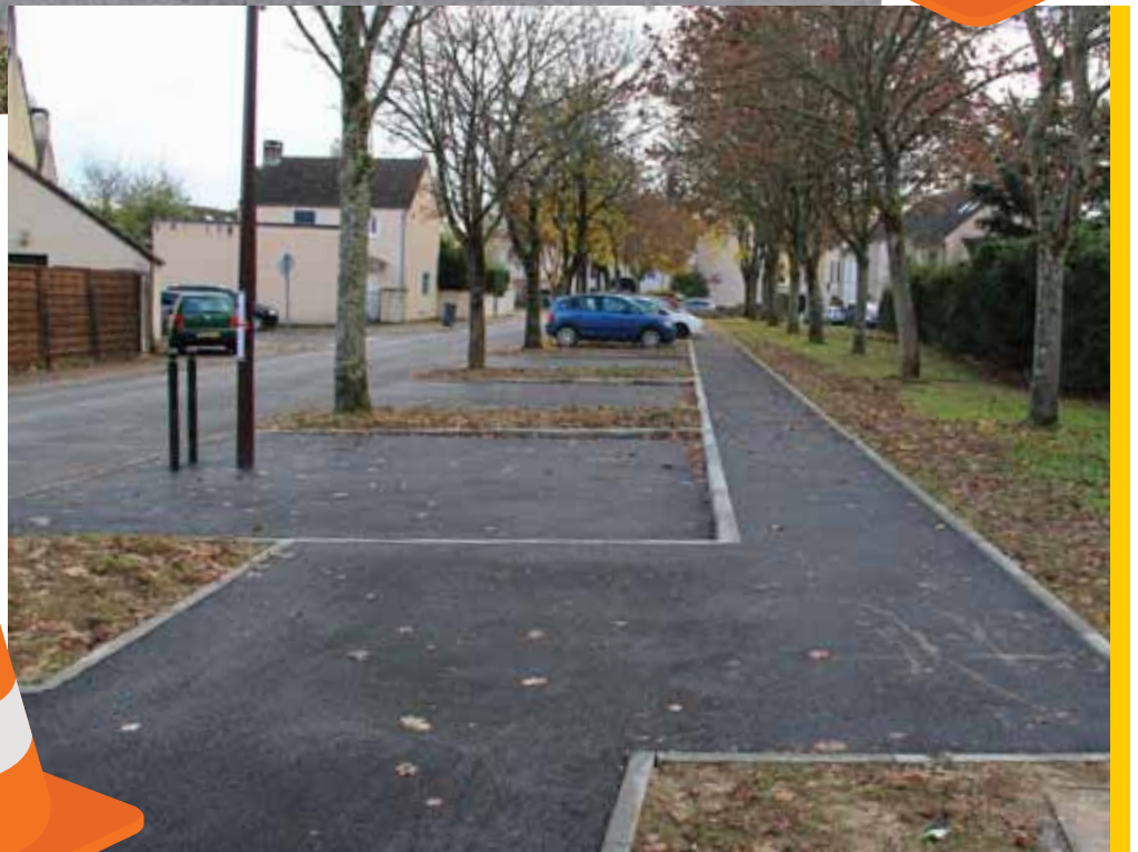
Rue des Champignons