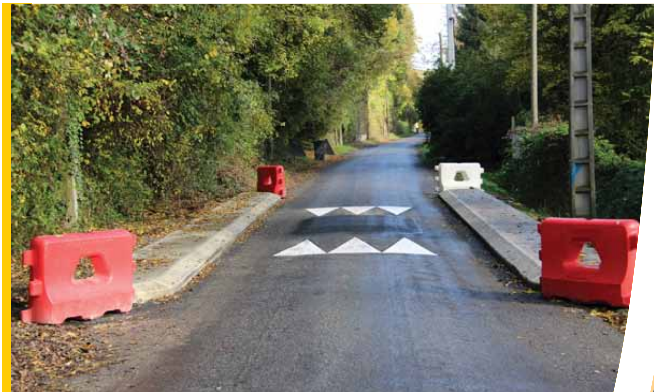
Route de Morsang