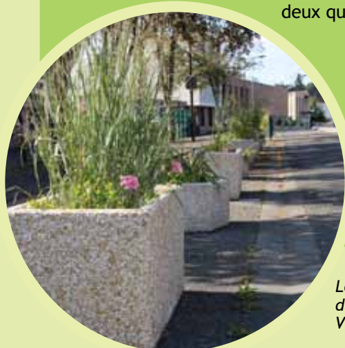
Les jardinières du quartier Villemur

Devant le succès, le dispositif sera étendu sur d'autres jardinières des deux quartiers.