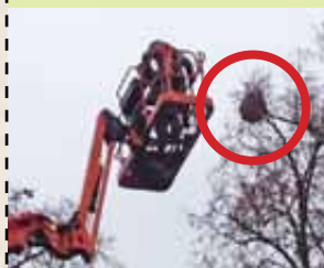
Destruction d'un nid de 1 m x 0,60 m de frelons asiatiques perché à 30 m dans un arbre déundé

Arrivé à Bordeaux en 2004 dans des poteries depuis la chine, il a colonisé presque toute la France dont la Seine-et-Marne et Nandy.