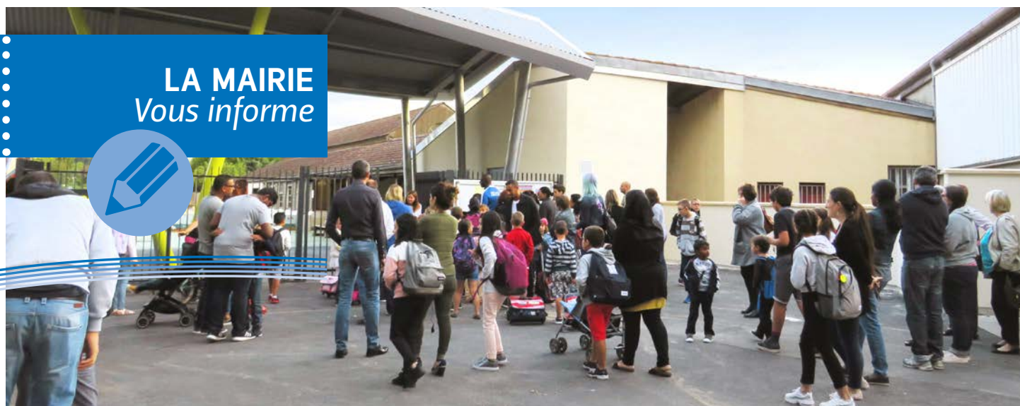
École du Balory