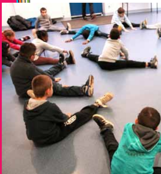
Break danse à la Maison de la nature.