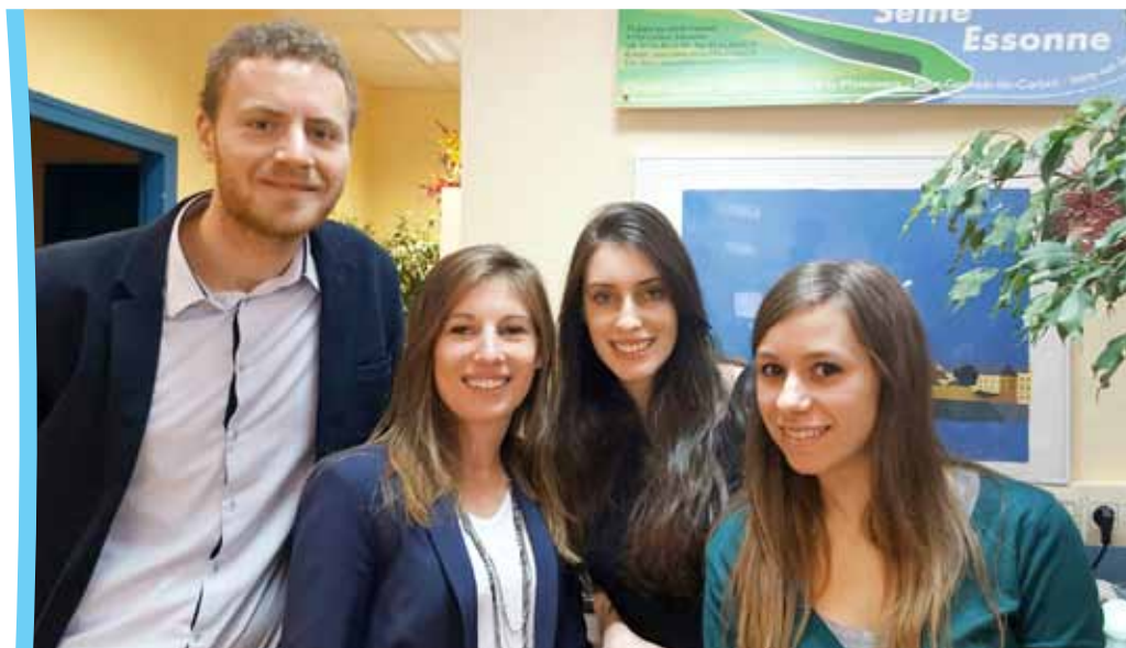
L'équipe de l'Office de Tourisme.

Au-delà de ses compétences obligatoires, l'agglomération Grand Paris Sud a choisi de développer le tourisme sur son territoire. Elle va ainsi promouvoir le potentiel touristique des 24 communes qui la composent et donc de Nandy !