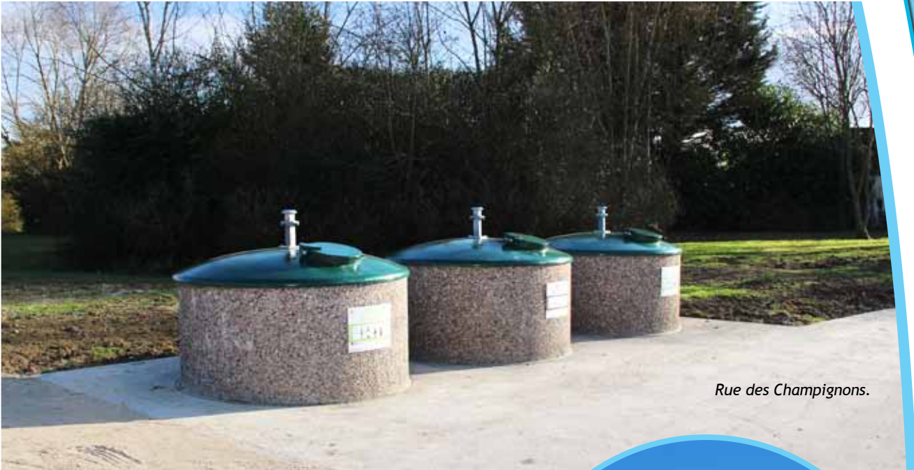
Rue des Champignons.