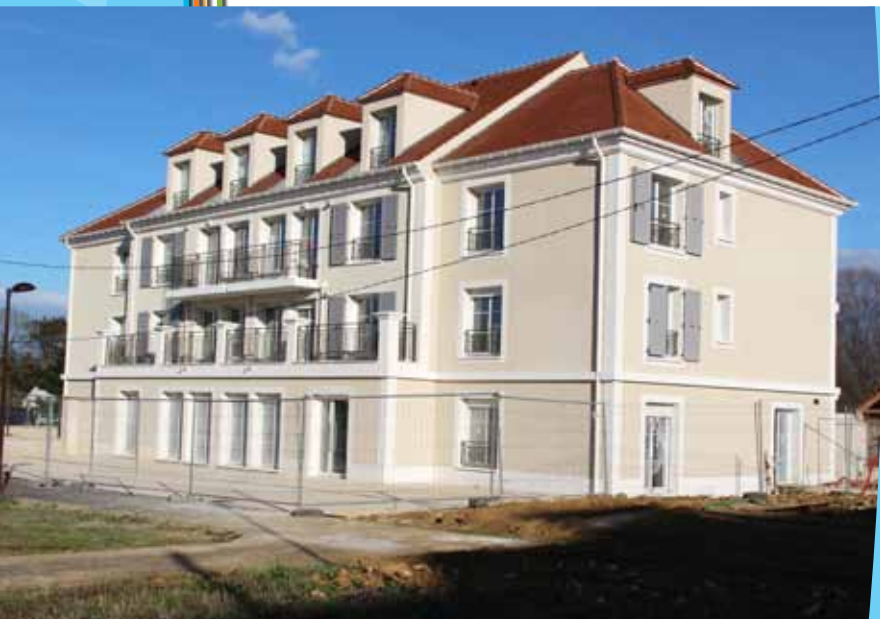
Future maison médicale de Nandy la Forêt (en rez-de-chaussée).

L'année 2017 devrait s'inscrire dans la même veine que la précédente : une gestion financière saine, un budget maîtrisé, des investissements soutenus, notamment dans la santé, la sécurité, l'éducation. Et la valorisation du patrimoine.