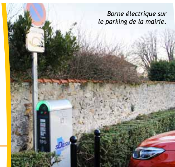
Borne électrique sur le parking de la mairie.

Dans la pratique, une fois stationné sur la place de recharge, il faut s'identifier à la borne en passant son badge au niveau du lecteur. La trappe d'accès aux prises se déverrouille pour permettre le branchement. Il suffit de brancher le câble à son véhicule et la recharge du véhicule débute.