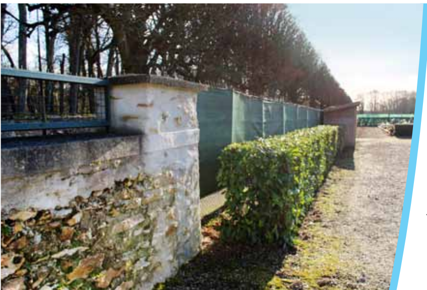
Cimetière de Nandy.