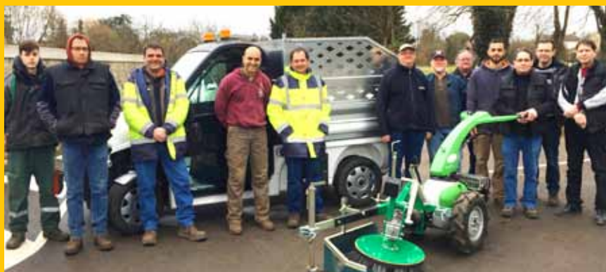
L'équipe des services techniques.

Par ailleurs, depuis cet hiver, un véhicule-benne électrique circule dans les rues de la commune. Avec une autonomie de 50 km, il est silencieux et innovant et permet à l'équipe "Propreté" d'effectuer, par exemple, des ramassages sur la commune, tôt le matin, sans déranger les riverains.