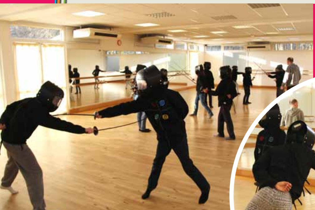
Escrime à la Maison des arts et de la danse.