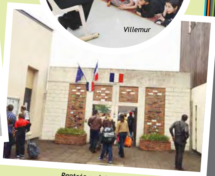
Rentrée scolaire 2015 au Balory