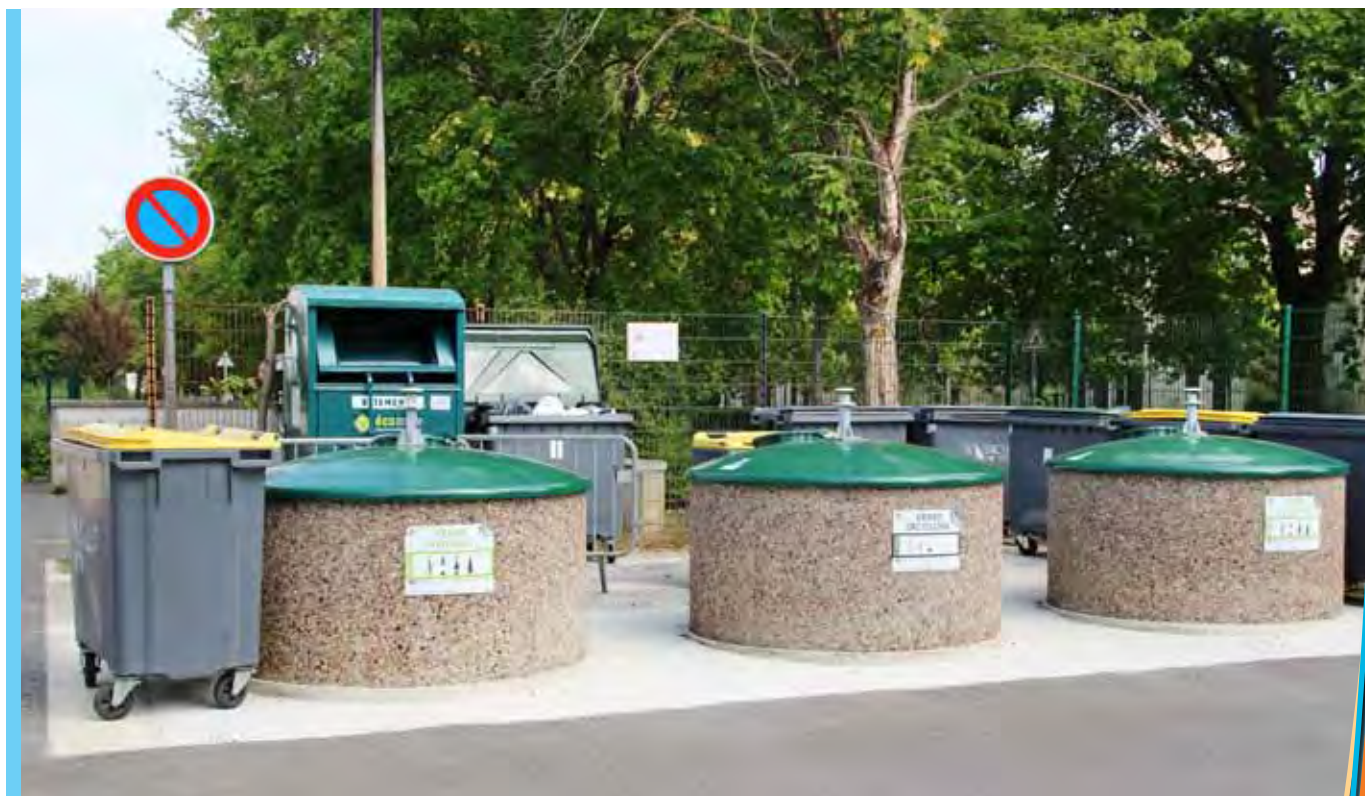
Nouveaux Points d'Apport Volontaires installés rue des 18 Sous.

À noter que trois Bornes à vêtements viendront prendre place à l'école des Bois, l'école de Villemur et la Bergerie et seront gérées par le SICTOM.