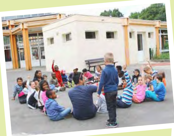
Les Bois - Maternelle