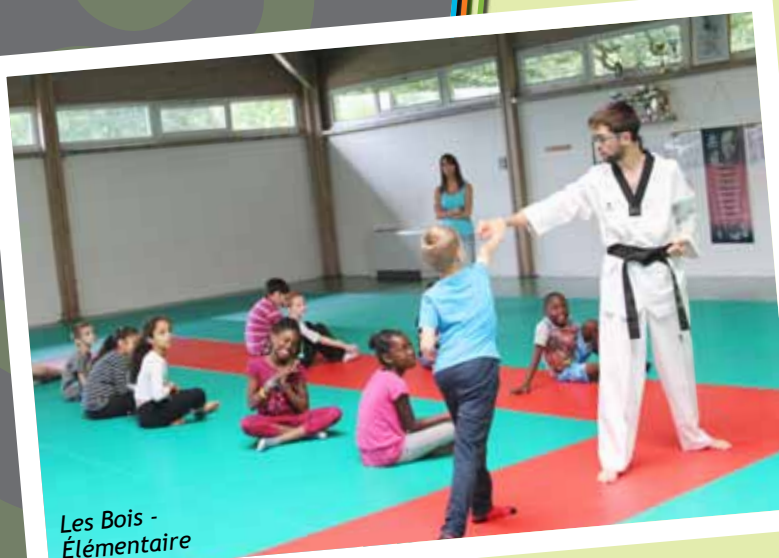
Les Bois - Élémentaire

15 Rentrée scolaire 2015 : de nouvelles initiatives