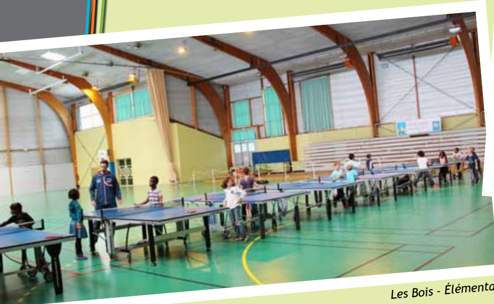
Les Bois - Élémentaire

Et ce sont les enfants qui en tirent le plus grand bénéfice !