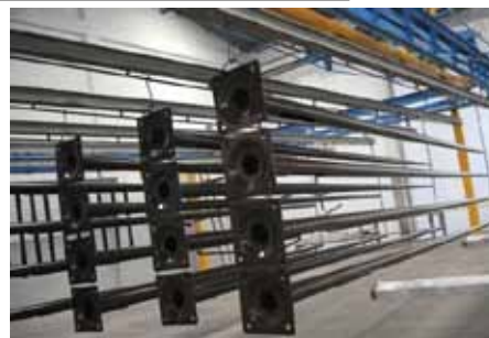
Les premiers mâts sortent d'usine

En attendant la réalisation effective des travaux, nous vous proposerons des montages photos projetant votre éclairage public après travaux :