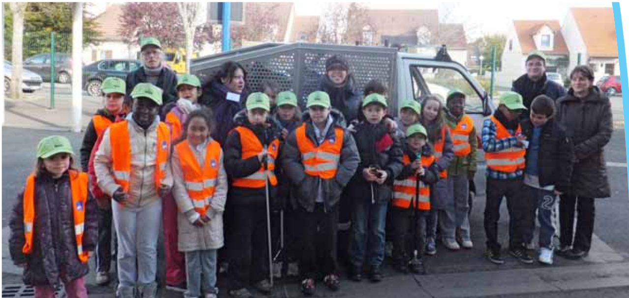
Ramassage des déchets du CMS (27/10/2012).

Afin d'œuvrer aux côtés du San dans la réalisation du Plan Climat, la commune s'engage à travers des actions fortes dans son comportement environnemental. Découverte de 5 actions.