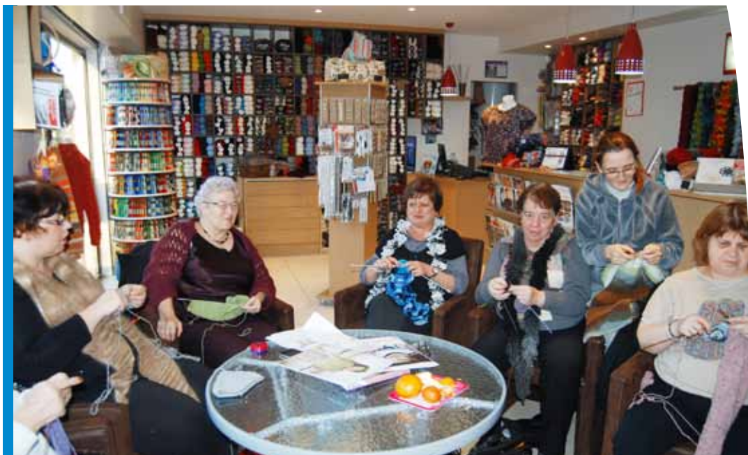
Le «Café aux Laines» accueille les passion- nées de tricot !