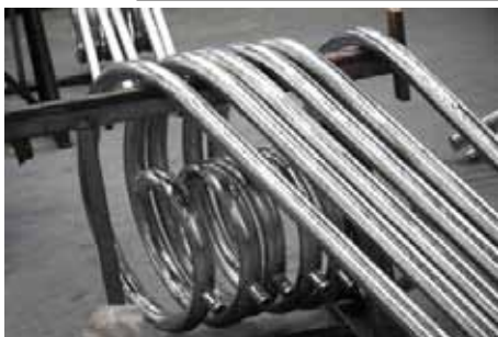
Les premières crosses de style sortent de production (avant peinture)

Les usines produisent les nouveaux mâts de Nandy